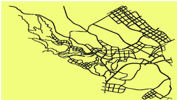
图2 产业南翼片区道路规划图

1. 此区块（主要包括河边镇、磨家镇、永兴镇、界牌镇）地名格局已相对稳定，沿用现有地名是首要任务。