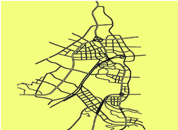
图4 中央创新驱动区北部片区(青义-龙门)道路规划图

1. 此区块(主要包括青义镇、龙门镇)地名格局已相对稳定,沿用现有地名是首要任务。