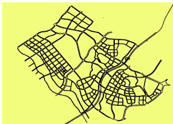
图3 核心区道路规划图

第五十八条 核心区（安昌河以北，包括涪城区金家林—科创园部分区域—教育园区—安州河东部分区域）街（路）、巷命名指引